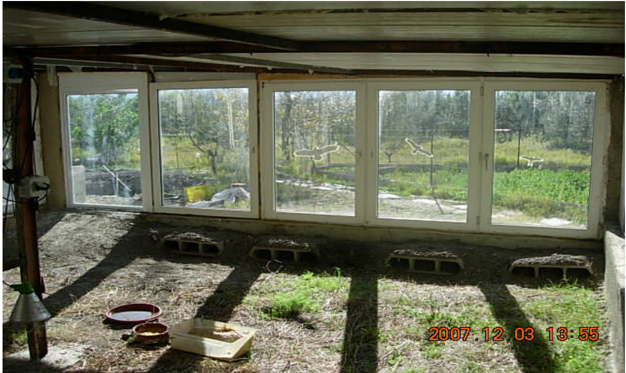
Invernadero para las “Tortugas de Egipto” .....

..... junto con aviario/reptilario cubierto por tela metálica