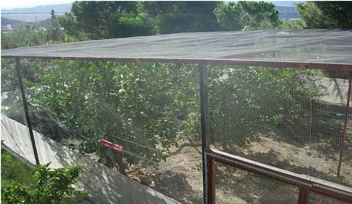
Otros invernaderos independientes