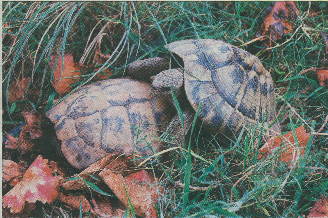
Tortugas mediterráneas, una de las muchas especies de la reserva.

Sobre el objetivo último de su asociación,