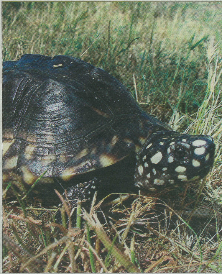
Ejemplar de tortuga hamiltoni, características por las manchas blancas de su piel. / H.S.

ción, el fundador de Arco aclara: «No tenemos a estas tortugas aquí como mascotas, sino para que se reproduzcan y no desaparezcan». Su duro acento, híbrido entre germano y andaluz, se irrita al recordar que muchas de las especies que ahora viven en Arco fueron abandonadas por sus dueños cuando éstas servían como mascotas en pequeñas piscinas de plástico azul. «Cuando crecen la gente no las quiere porque ya no son muy bonitas», apunta Schleich. «Y entonces se libran de ellas de forma inculta y no permitida. Muchas de las tortugas que aquí viven no acabaron de milagro en el fondo del retrete. A otras las lanzan al campo o a pantanos», sentencia. La introduc-