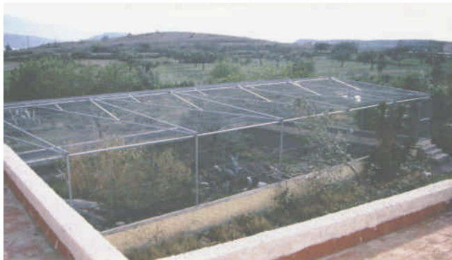
Eine der Freilandanlagen