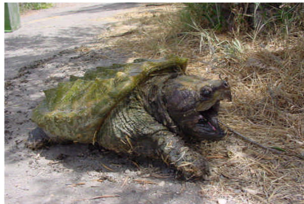
Alligator-Schnappschildkröte – Macroclemys