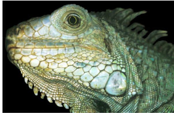
Grüner Leguan - Iguana iguana