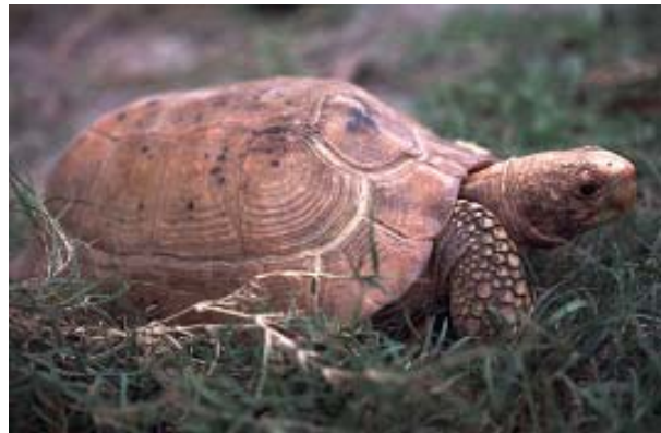
Indotestudo elongata Yellow-headed tortoise