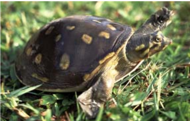
Lissemys punctata Indian flap-shelled turtle

Three specimens of Lissemys punctata , 1 male 2 females, also were brought to one of the big ponds in the new enclosure, while Melanochelys already bred first time there last year.