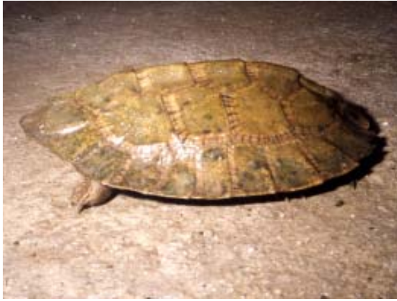
Cyclemys oldhami (Oldham's leaf turtle); juvenile