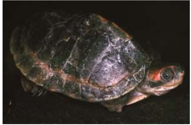
Pangshura tentoria circumdata (Pink ringed roofed turtle)